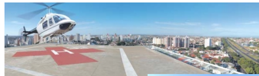
HELIPORTO (BENEFICÊNCIA PORTUGUESA)